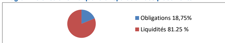
Diagramme circulaire indiquant la répartition des placements