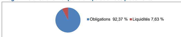
Diagramme circulaire indiquant la répartition des placements